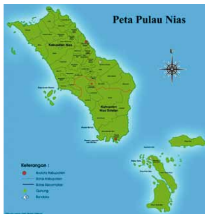
Kaart Nias Batu

Aan het einde van de Tweede Wereldoorlog kwam daar een groeiend besef van het onafhankelijk willen zijn van de koloniale bezetter bij. Inmenging in de geloofsbeleving en de daaraan gekoppelde zending werden niet meer zomaar geaccepteerd. Er was sprake van een kentering van de gezagsverhoudingen door het nieuwe bewustzijn van eigen cultuur en traditie.