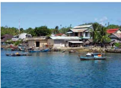
Haven Pulau Telio

M et de aanvang van de Tweede Wereldoorlog veranderde de positie van de zending in de koloniën. Aan de samenwerking tussen de Rheinische Missionsgesellschaft (RM) en het Nederlands Luthersch Genootschap op Nias en de Batu-eilanden kwam in 1940 een einde. Daaraan voorafgaand had de RM moeite om positie te bepalen in het opkomend nationaalsocialisme in Duitsland: in de jaren 30 van de vorige eeuw maakte de RM aanvankelijk deel uit van de Deutsche Christen , maar distantieerde zich daar later van en wilde ook niet opgenomen worden in de Reichskirche . Men zocht aansluiting bij de Bekennende Kirche , waar ook Karl Barth en Dietrich Bonhoeffer lid van waren.